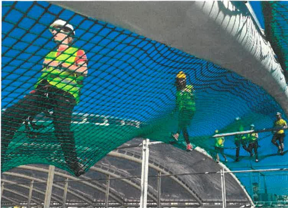
BW Galerija Belgrad Waterfront