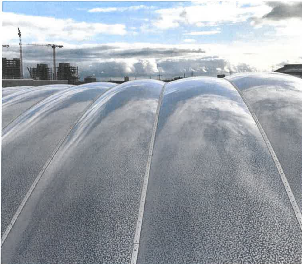
Büro- und Verwaltungsgebäude HELABA